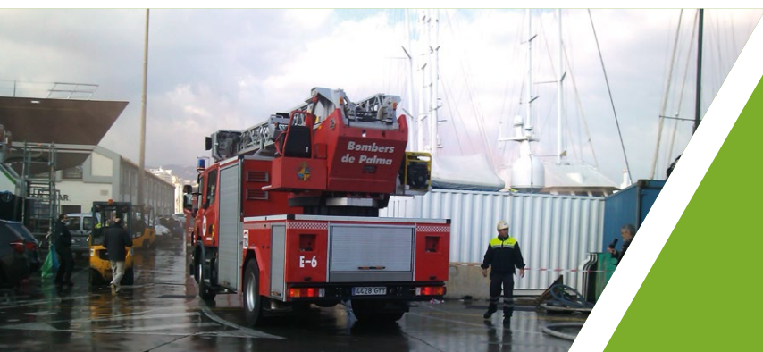
Simulacro de incendio y ejercicio de extinción de una embarcación en las instalaciones de Servicios Técnicos Portuarios (STP) en el puerto de Palma.

Cabe recordar que, además de los medios con los que cuenta la APB para prevenir la contaminación marina accidental, en todos los puertos se cuenta con los medios que aportan los concesionarios y los prestadores de los servicios portuarios: prácticos, remolcadores, amarradores, con sus respectivas embarcaciones y vehículos.