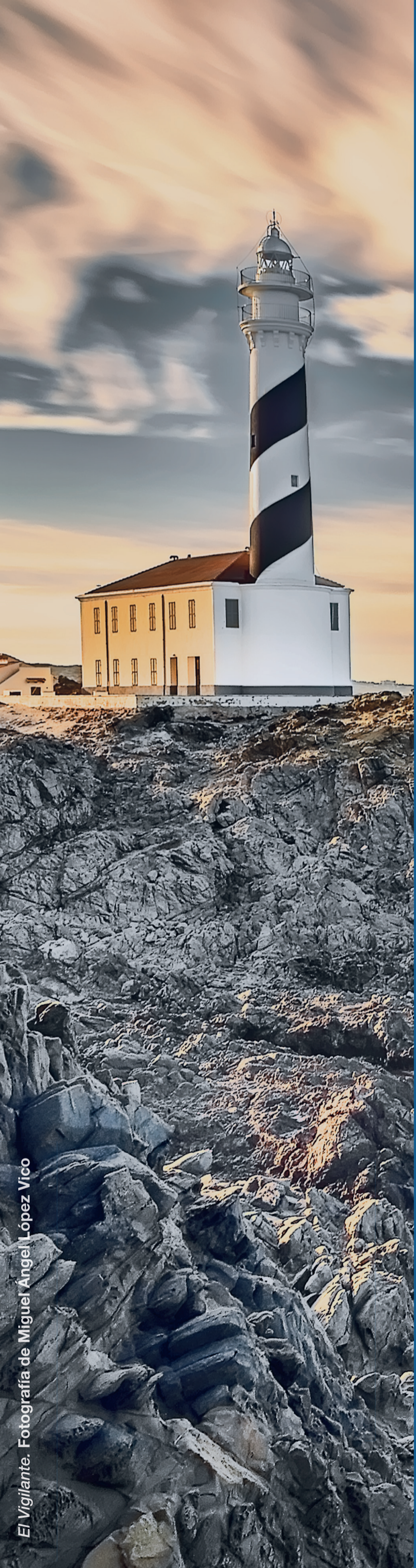
El Vigilante.